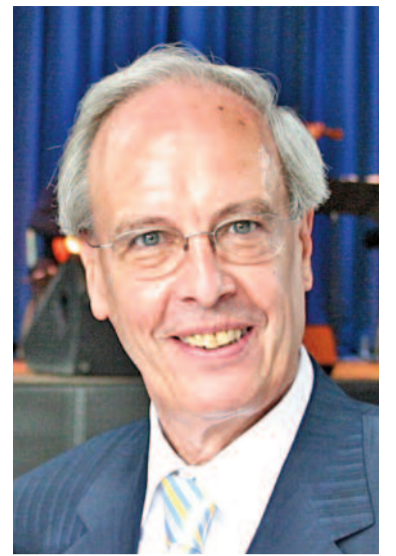
Herzliche Grüße und viel Freude, wann und wo auch immer

Es gibt dazu viele Gelegenheiten. Ich wünsche Ihnen, dass Sie möglichst viele erkennen, nutzen und davon auch persönlich bereichert werden. Die Freude an der Arbeit sollte ein Ziel werden, mit dem sich jeder Beteiligte am Arbeitsprozess dauerhaft identifiziert, über die Karnevalszeit hinaus.