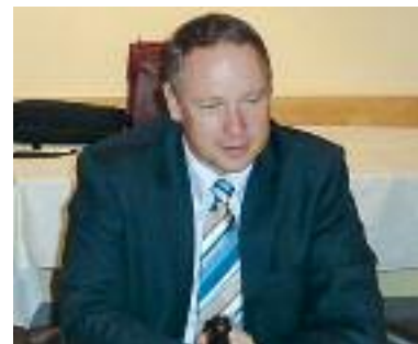
Georg Fahrenschon