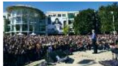
Gedenkveranstaltung für Steve Jobs.