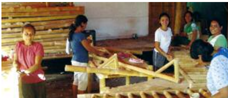
Aus Bambusholz fertigen Arbeiterinnen auf den Philippinen Möbel. In dem Inselstaat fördert die BKU-nahe AFOS-Stiftung Kleinunternehmer.

Mit einem neuen Ansatz der beruflichen Qualifizierung wollen CCCI und AFOS-Stiftung mit Unterstützung des BKU und der Handwerkskammer Düsseldorf die Kleinunternehmer zu höherer Produktivität befähigen. Entlang den Wertschöpfungsketten bestimmter Produkte sollen die landwirtschaftlichen Primärproduzenten, die weiterverarbeitenden Kleinunternehmer sowie die Klein-