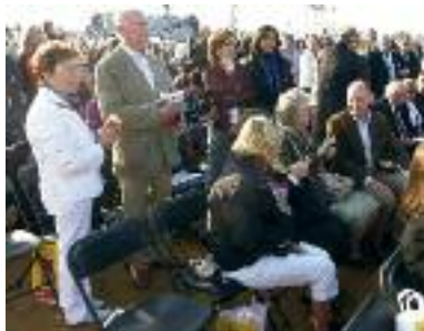
Vor der Messe (li.): warten auf den Papst. Dem Kreuz folgend (re.): die Wallfahrer auf den Höhen des Schwarzwaldes.