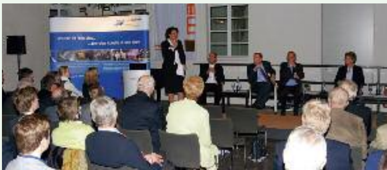
Die Diskussionsrunde im Maxhaus.