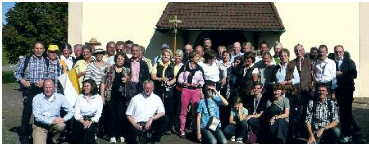
Im sonnigen Schwarzwald: die Teilnehmer der BKU-Wallfahrt in Maria-Lindenberg.