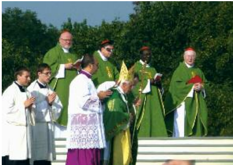
Einzug des Heiligen Vaters zur Messe in Freiburg.

Herausragend waren die Rede des Papstes vor dem Deutschen Bundestag, seine Ausführungen im Gespräch mit der EKD-Führung in Erfurt und die Ansprache im Freiburger Konzerthaus. „In deutscher Klarheit“, so überschreibt der römische Korrespon-