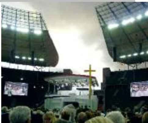
21 Dichte Atmosphäre: die Papstmesse in Berlin