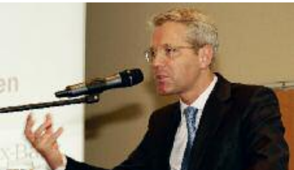
5 Nachhaltigkeit: Bundesumweltminister Röttgen beim BKU