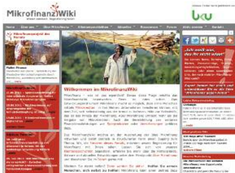
In neuem Gewand: Die Internetseite der Mikrofinanzplattform.

Nach dem Relaunch präsentiert sich die Seite mit mehr Inhalten und erweiterten Funktionalitäten. Das Webportal bündelt Informationen und Neuigkeiten zum weiten Feld der Mikrofinanz. In einer Basisversion ist das Mikrofinanz-Wiki bereits seit Sommer 2009 online. Finanziell und inhaltlich trägt ein Förderkreis der Mikrofinanzplattform Deutschland das Webangebot. „Aber auch Nutzer können Inhalte beisteuern“, erklärt Sandra Stank, Projektverantwortliche für das Mikrofinanz-Wiki bei „Opportunity Interna-