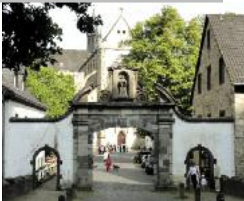
5-10 Ortswechsel: Die BKU-Frühjahrstagungen in Altenberg und Speyer