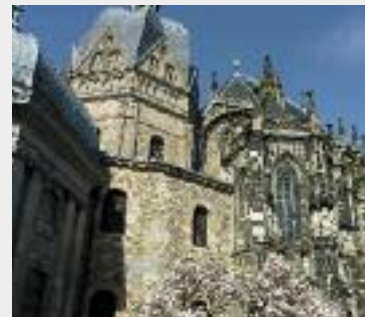
Weltkulturerbe Aachener Dom