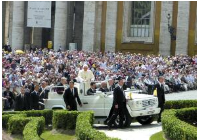
Ankunft von Papst Benedikt XVI. zur Generalaudienz auf dem Petersplatz. Die BKU-Gruppe konnte dieses Ereignis auf bevorzugten Plätzen verfolgen.