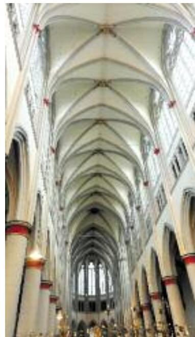
Nachhaltige Eindrücke hinterließ die klare gotische Architektur des Altenberger Doms.