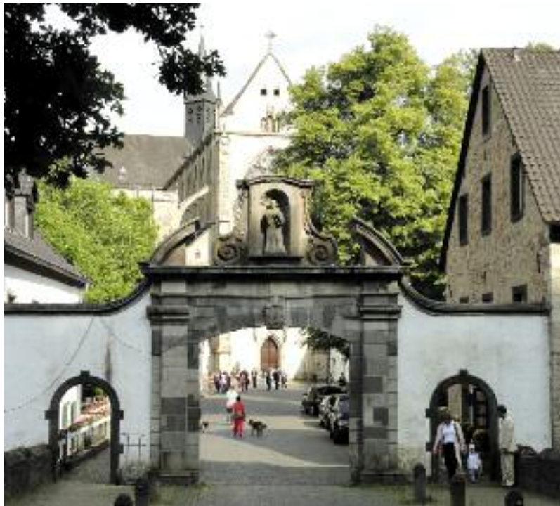
Imposante Kulisse für die BKU-Frühjahrstagung: Blick auf den Altenberger Dom.