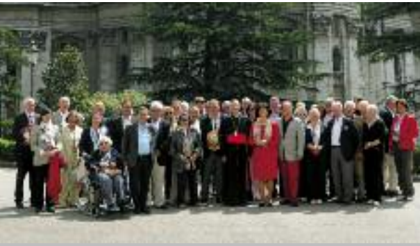
17-20 Gruppenbild vor dem Petersdom: Die Teilnehmer der BKU-Romreise 2011.